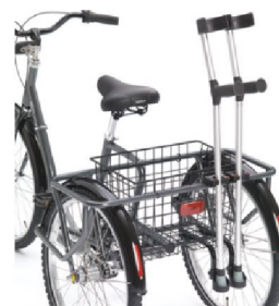
23233 24" Kryckkäppshållare m. korgfäste