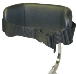
19094 Jörn 17930 Line 19086 Rasmus Kroppsstöd lågt m. fäste