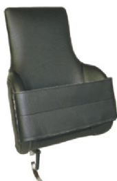
19095 Jörn 18916 Line 18942 Rasmus Kroppsstöd högt m. fäste