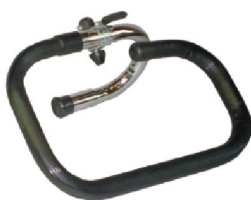
19098 Jörn/Line 19088 Rasmus 2-delat styre