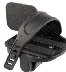
42365/42364 Balanserad pedal med sidostöd hö/vä