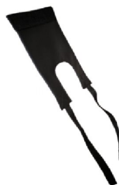
19096 Jörn/Line 18941 Rasmus Väst till högt kroppsstöd