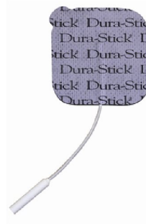
25466 Dura Stick Plus 5x5 cm fyrkant 4 st/fp