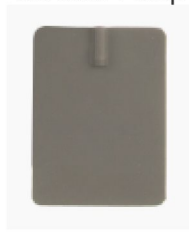
10084 Electrode sil/carbon 4-pack 6x8 cm