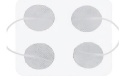
42724 Hudelektroder 30 mm rund 4 pack