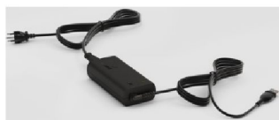
46661 Power supply unit (PSU) Air 11