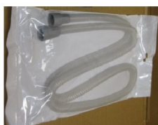
31472 Slang SlimeLine