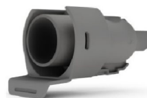
46660 Luftutsläpp Air 11