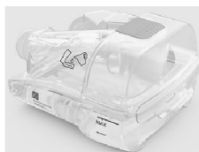
46658 Befuktare HumidAir 11