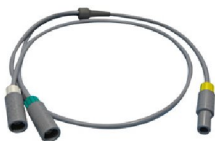
45409 Värmetrådsadapter (inspiratorisk/expiratorisk)