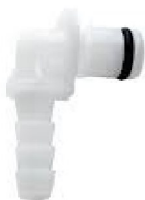
42393 Oxygensnabbkoppling Trilogy 2-pack (Passar även till Trilogy 100 och BiPAP A40 Pro)