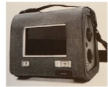
45215 Trilogy Evo Användarväska (används vid förflyttning under drift, ex. montering på rullstol)