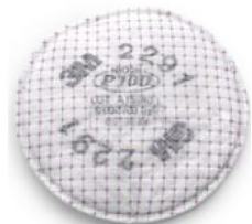
45218 Partikelfilter (obligatoriskt)