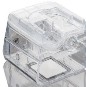
46423 Click-in Humidifier, Vivo 45