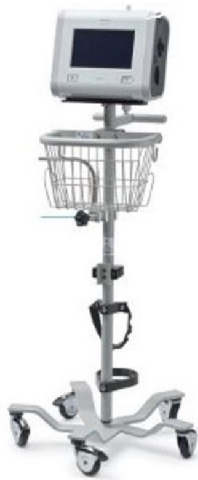
48600 Trilogy Evo Roll Stand (includes mounting plate, basket, handle, humidf mount and O2 tank holder)