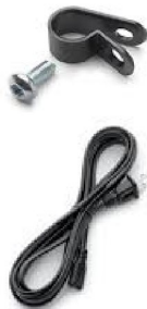
45216 RP- Trilogy Evo Powercord clamp 45214 Powercord, straight C7- End, 8-ft, Europé