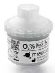
46324 FiO2 Sensor Assembly