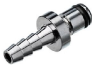
46431 Oxygen adapter low pressure (passar både till Vivo 45 & Vivo 50)