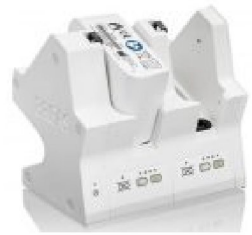
46427 Click-In Battery Charger (2 Bank) EU