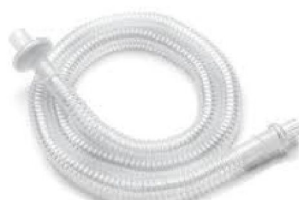
45349 Engångsslang inkl. bakteriefilter 22 mm Passiv krets