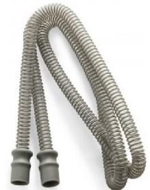
46438 Patient Circuit 15mm x 1.8m (006712 x 30st / fp)