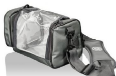
46429 Väska lättvikt (denna väska kan man hänga på rullstolens körhandtag, men den får inte utsättas för "hårda tag")