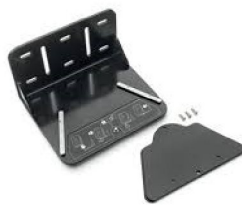
XXXXX Trilogy Evo Wheelchair Mount (includes mounting plate)