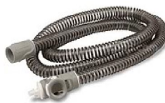
42268 ClimateLine Air Oxy (uppvärmd slang med syrgasport- möjlighet till inkoppling av syrgas)