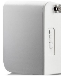
46422 Click-in battery, Vivo 45 / Vivo 45 LS