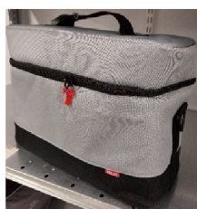
46439 Cary bag, Vivo 45