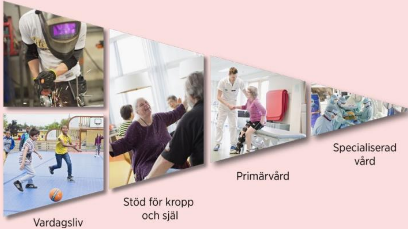
Figur 3 Illustration över omställningen

"Nära vård" – samverkande, individanpassad, förebyggande, hemnära hälso/sjuk-vård med tidig intervention.