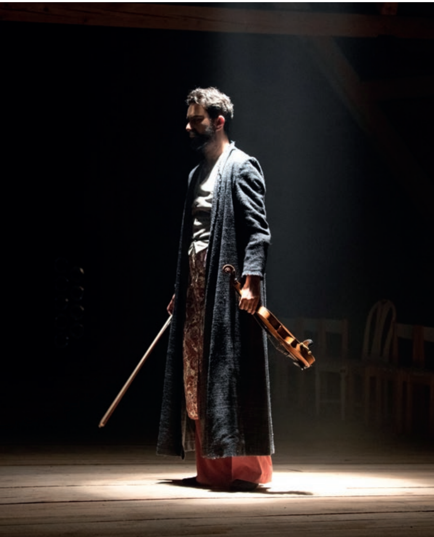
Scenkonst Sörmlands föreställning Tre Systrar , av Anton Tjechov på Idéfarmen i Dunker Lundby, Malmköping.