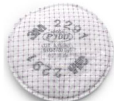
45218 Partikelfilter (obligatoriskt)