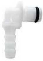
42393 Oxygensnabbkoppling Trilogy 2-pack (Passar även till Trilogy 100 och BiPAP A40 Pro)