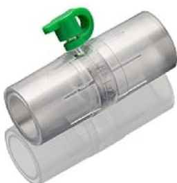
47390 Läckageadapter engångs