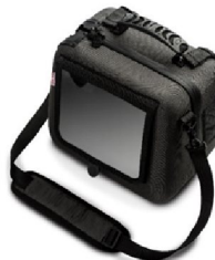
47081 Protective cover, Vivo 45 (denna väska används för "hårdare tag" och vid montering på rullstol)