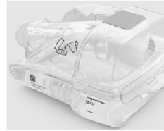
47446 HumidAir II befuktningskammare- Air 10 & Lumis