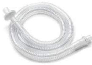
45349 Engångsslang inkl. bakteriefilter 22 mm Passiv krets