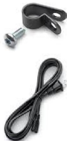
45216 RP- Trilogy Evo Powercord clamp 45214 Powercord, straight C7- End, 8-ft, Europé