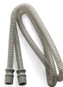
46438 Patient Circuit 15mm x 1.8m (006712 x 30st / fp)