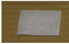
31473 Filter till Air 10/S9 serien, standard 2- pack (engångs)