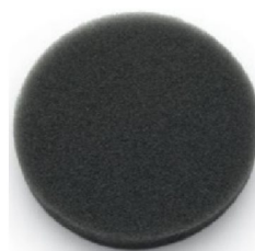
45219 Skumplastfilter (obligatoriskt)