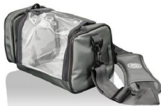
46429 Väska lättvikt (denna väska kan man hänga på rullstolens körhandtag, men den får inte utsättas för "hårda tag")