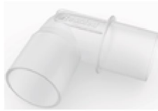
39104 Knärör till AirSense