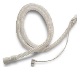
46421 Heated circuit, Vivo 45