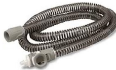
42268 ClimateLine Air Oxy (uppvärmd slang med syrgasport- möjlighet till inkoppling av syrgas)