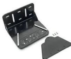
XXXXX Trilogy Evo Wheelchair Mount (includes mounting plate)