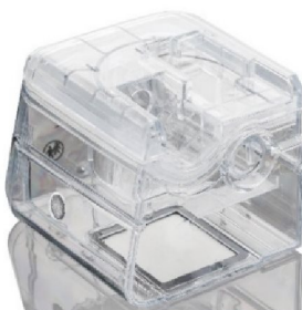
46423 Click-in Humidifier, Vivo 45