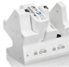
46427 Click-In Battery Charger (2 Bank) EU