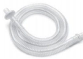
46407 Slang Pediatrisk inkl. bakteriefilter 15 mm Non-Htd, Passiv krets