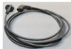
48274 Strömkabel 3m