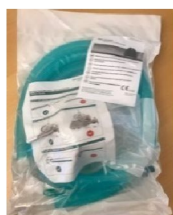
48259 Komplett slangset med befuktningskammare, passar till Trilogy 100/Evo och Vivo 50