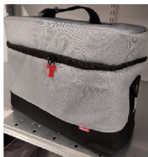
46439 Cary bag, Vivo 45