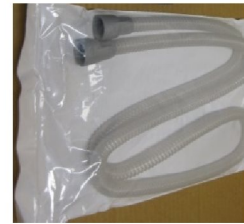
31472 Slang SlimeLine