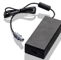
46437 AC Adapter, 19V, 6.13A