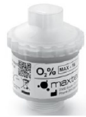
46324 FiO2 Sensor Assembly