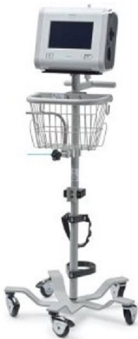
48600 Trilogy Evo Roll Stand (includes mounting plate, basket, handle, humidf mount and O2 tank holder)