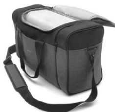
45217 Trilogy Evo Travel bag