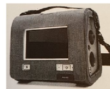
45215 Trilogy Evo Användarväska (används vid förflyttning under drift, ex. montering på rullstol)