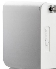
46422 Click-in battery, Vivo 45 / Vivo 45 LS