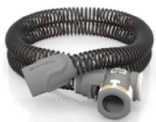
38133 Uppvärmad luftslang (ClimateLine Air)